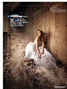
Beispiel von Practical Photoshop