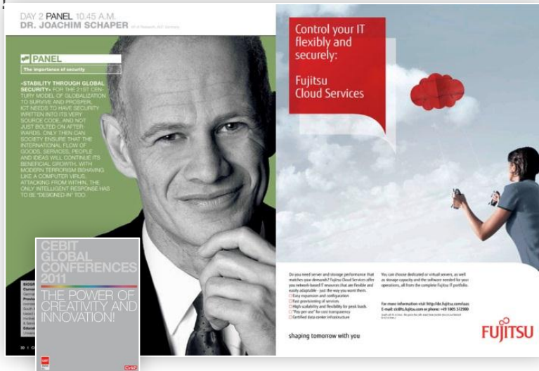
CGC-Magazin 2011 mit Fujitsu-Anzeige