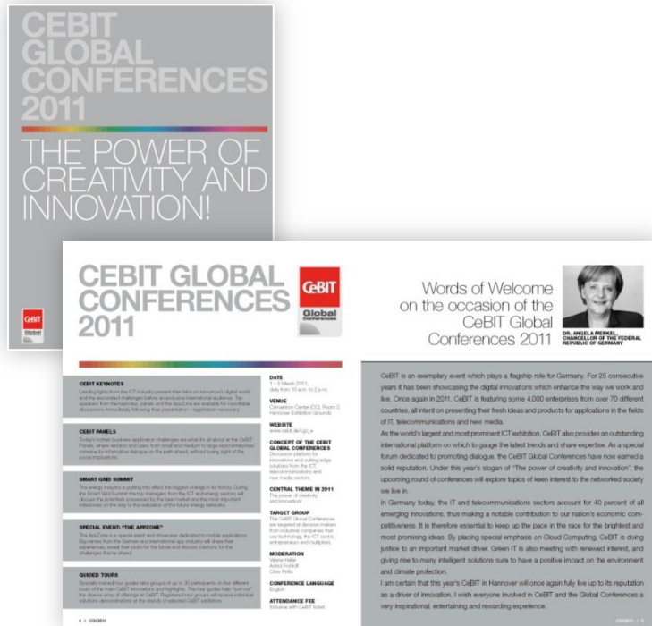
CeBIT Global Conferences Magazin 2011

Erreichen Sie die ITK-Entscheider zielgenau!