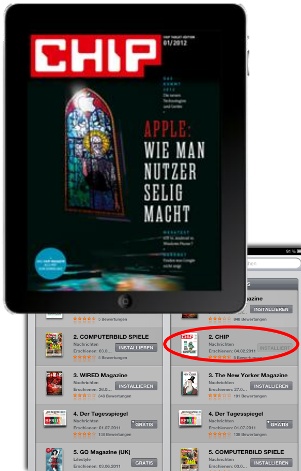
CHIP im AppStore